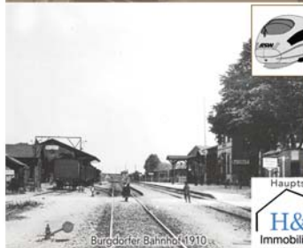
Burgdorfer Bahnhof 1910