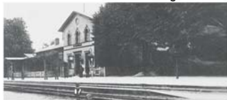
Burgdorfer Bahnhof 1907

In der KulturWerkStadt ist vom 9. November bis 4. Januar sonntags von 14 bis 17 Uhr die Ausstellung „Burgdorfer Familiengeschichten“ zu sehen. Historische Fotos, Dokumente und persönliche Erinnerungsstücke geben dabei lebendige Einblicke in das Leben und die Traditionen ausgewählter Burgdorfer Familien vergangener Generationen bis in die Gegenwart.