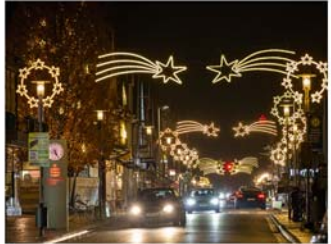
20. Burgdorfer Lichtwochen