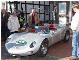
Oldtimer-Schau zum Stadtfest Oktobermarkt

Samstag, 4. Oktober, 14 Uhr Stadtfest Oktobermarkt: Oldtimer-Schau Obere Marktstraße/ Bürgermeister Schuster-Park Veranstalter: VVV-Oldtimer-Treff Anmeldung: Tel. 05136 - 1862