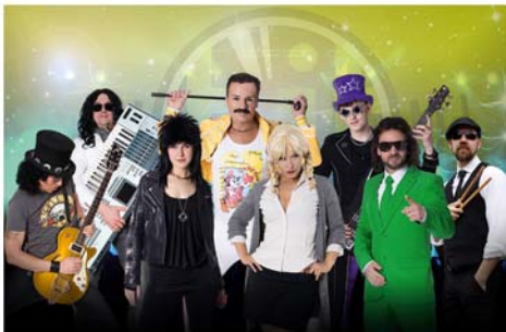
„HIT RADIO SHOW“

Am Sonntag beginnt der Tag mit dem Großflohmarkt in der Altstadt. Ab 13 Uhr sorgt der Verkaufsoffene Sonntag mit rund beteiligten 40 Geschäften für ein zusätzliches Einkaufserlebnis. Gleichzeitig organisieren die Stadtjugendpflege und der Verein für Kunst und Kultur (VKK) die Kinder- und Jugendaktionsmeile auf der unteren Marktstraße.