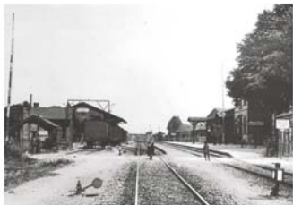
Burgdorfer Bahnhof 1910

Stadtmuseum, Schmiedestr. 6 Öffnungszeiten: Samstag und Sonntag von 14 bis 17 Uhr Sonderöffnungszeiten zum Stadtfest Oktobermarkt: 3. bis 5. Oktober Veranstalter: VVV + Förderverein Stadtmuseum + Stadt Burgdorf in Zusammenarbeit mit Stiftung Eisenbahnsozialwerk/MEC Hannover, Tel.: 05136 - 18 62