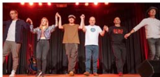
9. Comedy-Nacht im StadtHaus

Dienstag, 28. Oktober, 20 Uhr „StadtHausSterne“: Burgdorf lacht – die 9. Comedy-Nacht Veranstaltungszentrum StadtHaus, Sorgenser Str. 31 Veranstalter: StadtHaus Burgdorf, der junge VVV, Verein für Kunst und Kultur in Burgdorf (VKK) und JohnnyB. Kartenvorverkauf: Bleich Drucken und Stempeln, Braunschweiger Str. 2, Tel. 05136 – 1862, und www.reservix.de