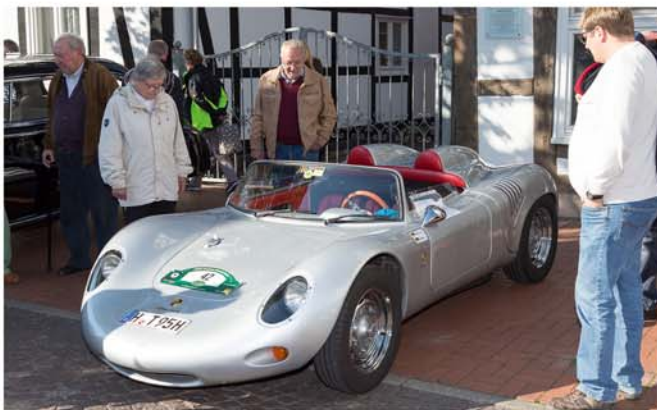
Oldtimer-Schau zum Stadtfest Oktobermarkt