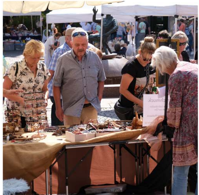
Kunstmarkt auf dem Spittaplatz

Sonntag, 7. September, 13.00 bis 18.00 Uhr