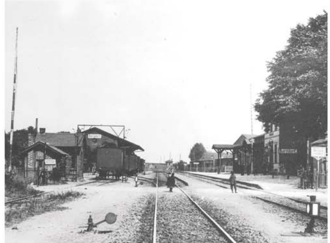
Ausstellung zur städtischen Eisenbahngeschichte: Burgdorfer Bahnhof 1910