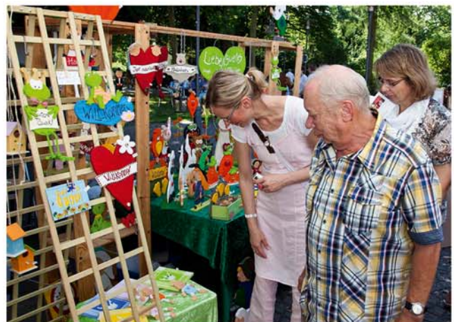
47. Kunstmarkt auf dem Spittaplatz

der Innenstadt zum entspannten Einkaufsbummel und Verweilen ein.