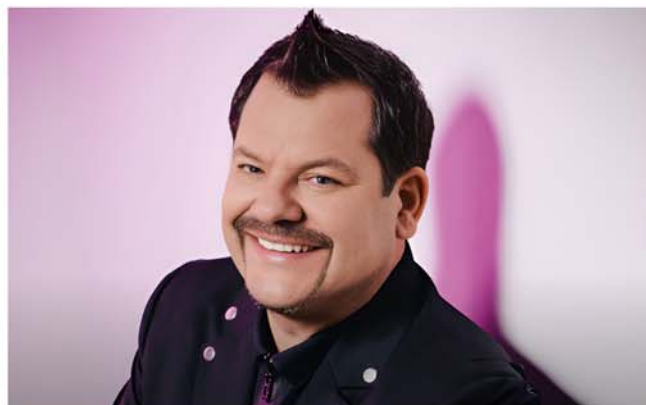
Comedian Ingo Appelt im StadtHaus