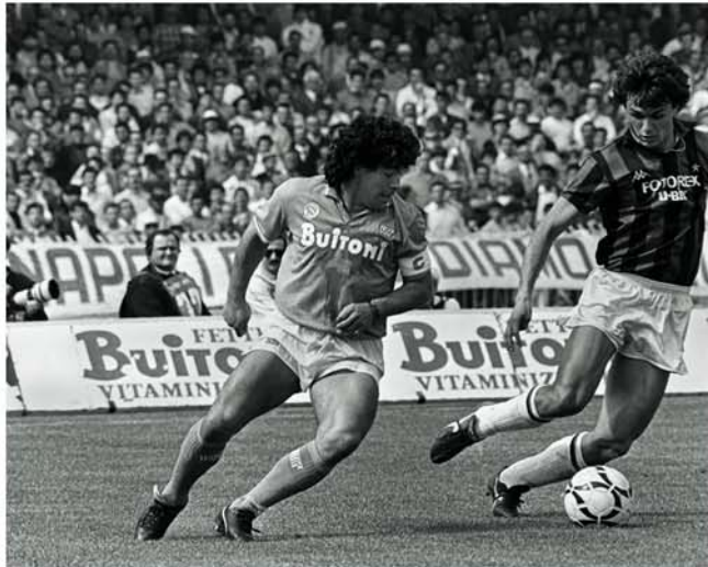
Maradona-Ausstellung im Stadtmuseum