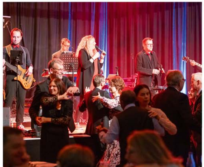
7. Burgdorf-Ball im StadtHaus

Braunschweiger Str. 2, Tel. 05136 – 1862