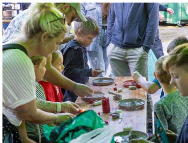
Letzter Pferde- und Hobbytiermarkt der Saison mit großem Kinderfest

Veranstalter: VVV Burgdorf, Tel.: 05136 - 1862