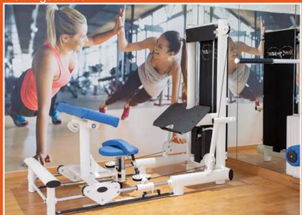
Getrennter Trainingsbereich (Lady-Fitness)