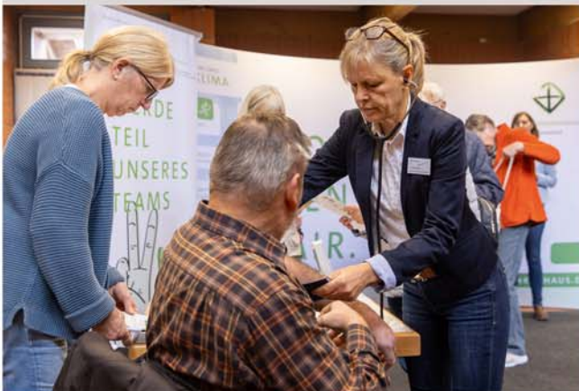
8. Burgdorfer Gesundheitstag

Der Burgdorfer Gesundheitstag kehrt mit seiner achten Ausgabe zurück. Die Vorbereitungen für den vom Stadtmarketing Burgdorf organisierten Infotag, der seit seiner Premiere im Jahr 2008 stets auf eine hervorragende Resonanz stieß, laufen aktuell auf Hochtouren. Das Ziel dieser Veranstaltung bleibt nach wie vor, Burgdorf als eine Stadt zu präsentieren, in der sowohl die Gesundheitsvorsorge und -erhaltung als auch die Krankheitsrehabilitation einen herausragenden Stellenwert haben.