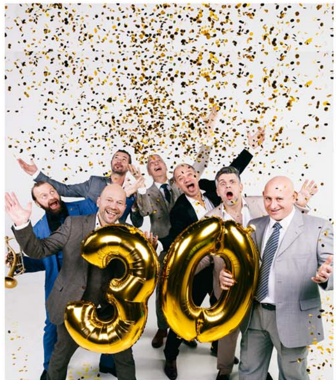
Neujahrskonzert mit MNOZIL BRASS

Hits. Das Programm beinhaltet bekannte Songs wie "Music Was My First Love" von John Miles, "Tears in Heaven" von Eric Clapton und "Englishman in New York" von Sting. Ein "80er Medley" vereint Titel wie "The Final Countdown" von Europe, "Woman in Love" von den Bee Gees, "99 Luftballons" von Nena und "You're the One that I want" von Olivia Newton-John und John Travolta. Sogar Rock-Hymnen wie "Highway to Hell" und "Back in Black" von AC/DC sind Teil des Repertoires.