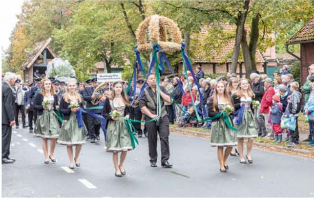
Erntefest in Ramlingen