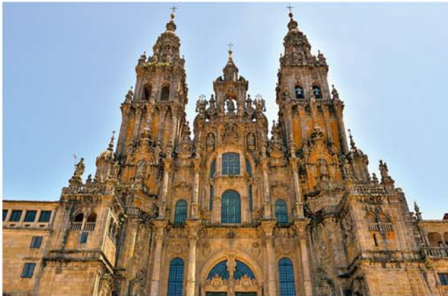
Kathedrale Santiago de Compostela

Galicien in Nordspanien ist das sogenannte „grüne Spanien“ und der Endpunkt des Camino de Santiago, dem sogenannten Jacobsweg. Gleich auf dem Platz vor der Kathedrale, in der sich das angebliche Grab des heiligen Jacobus befindet, trifft man auf viele Pilger, die Teile des Jacobsweges gegangen sind. Die Besichtigung der Kathedrale sollte man auf jeden Fall machen. Auch die Teilnahme an einer Pilgermesse ist sehr beeindruckend. Deshalb sollte ein Aufenthalt in Santiago mehrere Tage dauern, weil die Sehenswürdigkeiten in dieser Stadt sehr interessant und vielfältig sind.