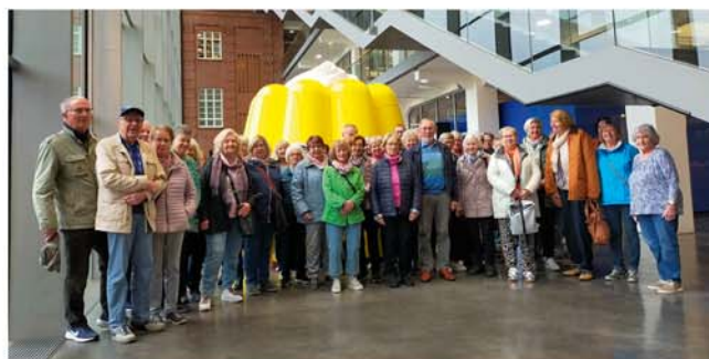
VVV-Reisegruppe vor dem Puddingwunder der Dr. Oetker-Welt