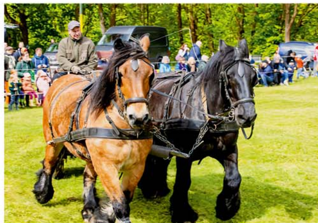
Start der 46. Pferde- und Hobbytiermarkt-Saison

262. Pferde- und Hobbytiermarkt Pferdemarktplatz / Kleiner Brückendamm Veranstalter: VVV, Tel.: 05136 - 1862