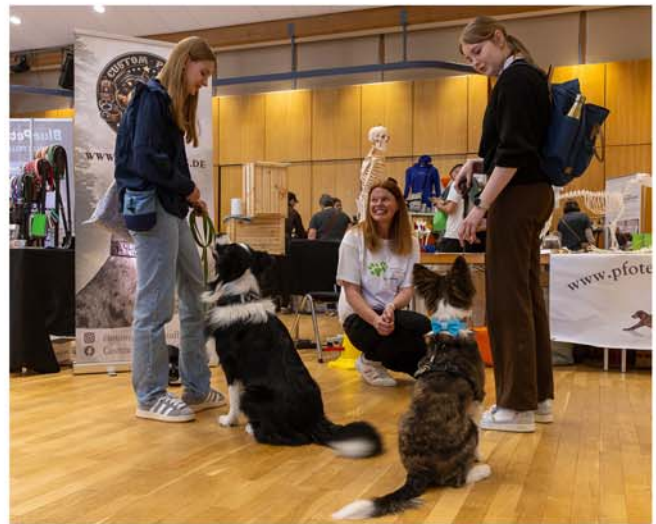
3. Burgdorfer Hundemesse im StadtHaus

Veranstaltungszentrum StadtHaus, Sorgenser Str. 31 Veranstalter: StadtHaus Burgdorf Kartenvorverkauf: Bleich Drucken und Stempeln, Braunschweiger Str. 2, Tel. 05136 - 1862, und an der Tageskasse