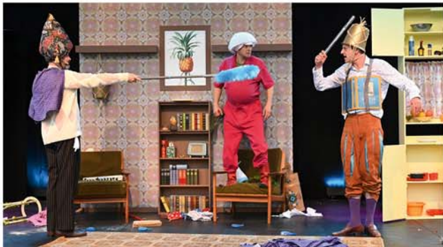
Schauspiel „Don Quijote“ im Theater am Berliner Ring

Theater für Niedersachsen: „Don Quijote“ Schauspiel von Rebekka Kricheldorf nach Miguel de Cervantes Theater am Berliner Ring Veranstalter: VVV + Stadt Burgdorf Kartenvorverkauf: Bleich Drucken und Stempeln, Braunschweiger Str. 2 Tel.: 05136 - 1862, und www.reservix.de