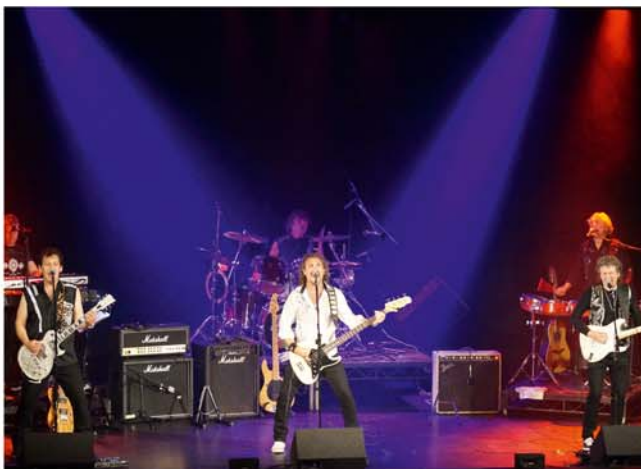
JUKEBOX HEROES im StadtHaus