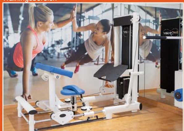
Getrennter Trainingsbereich (Lady-Fitness)