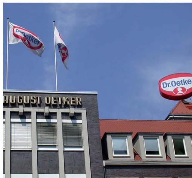
Die Dr. Oetker-Welt in Bielefeld

Residenz der Grafen und Fürsten zu Schaumburg-Lippe. Umgeben von einer Graft liegt das 1302 erbaute Residenzschloss auf der Schlossinsel. Zunächst haben die Teilnehmer die Gelegenheit, den Schlosspark aus der Zeit um 1560 zu erkunden und einen Abstecher in den Marstall mit seinen mehr als 1.000 kulturhistorischen Exponaten zu unternehmen. Bei der anschließenden Führung durch das Schloss beeindruckt besonders der Goldene Saal mit der berühmten Götterpforte und der Große Festsaal. Sehenswert ist außerdem die Schlosskapelle mit ihren aufwändigen vergoldeten Schnitzereien. Hinterher besteht die Möglichkeit, in der Schlossküche zum Kaffeetrinken einzukehren.