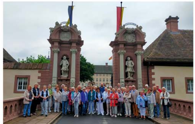
Die VVV Ü 50-Reisegruppe vor dem Kloster Corvey