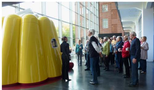
Kulturfahrt zur Dr. Oetker-Welt

Abfahrt auf dem Schützenplatz Veranstalter: VVV Ü 50 – Club für aktive (Un)Ruheständler Teilnehmerkarten: Bleich Drucken und Stempeln, Braunschweiger Str. 2, Tel. 05136 - 1862