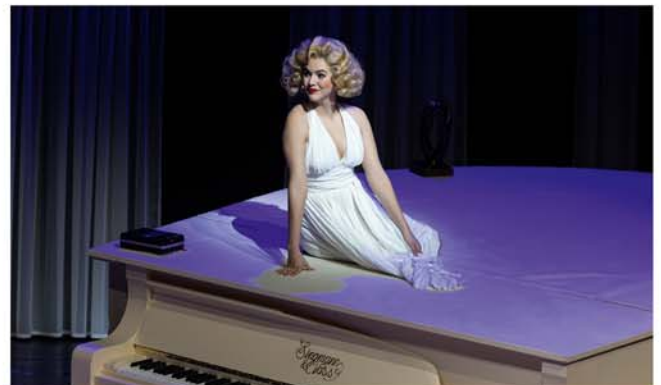
„Unendliche Sterne“ im Theater am Berliner Ring

Glitzernder, musikalischer Abend über unvergessene Ausnahmekünstlerinnen Theater am Berliner Ring Veranstalter: VVV + Stadt Burgdorf Kartenvorverkauf: Bleich Drucken und Stempeln, Braunschweiger Str. 2 Tel.: 05136 - 1862, und www.reservix.de