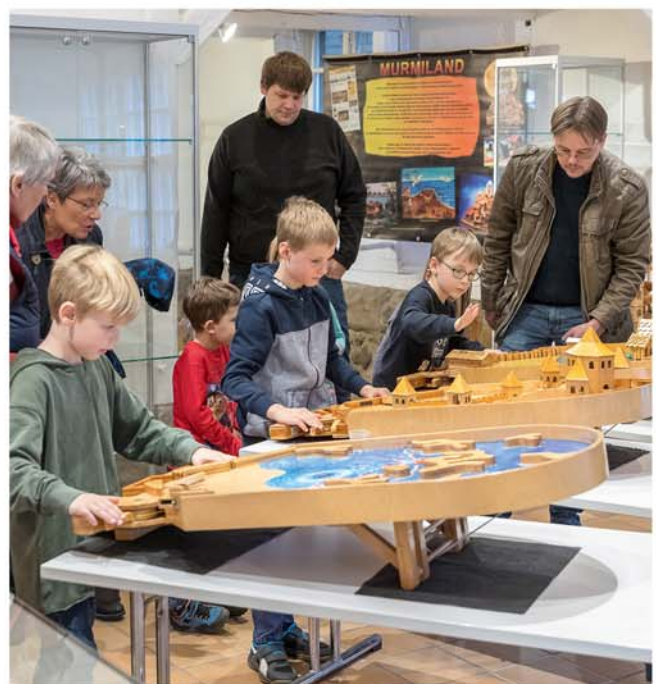
35 Jahre MURMILAND-Mitspielausstellung

In der Ausstellung sind zahlreiche aufwändig konstruierte Murmelbahnen aufgebaut, bei denen es sich um bis ins kleinste Detail ausgetüftelte mechanische Kunstwerke handelt. Auf ihnen bahnen sich die bunten Glaskugeln ihren Weg durch imposante Burgen und kunstvoll gestaltete Flipper in allen Variationen. Die Murmelkunstwerke sind nicht nur zum Anschauen und Staunen errichtet. Alle Besucher können die ausgestellten Objekte aktiv bespielen und die Glaskugeln auf die Reise durch verschlungene Pfade senden.