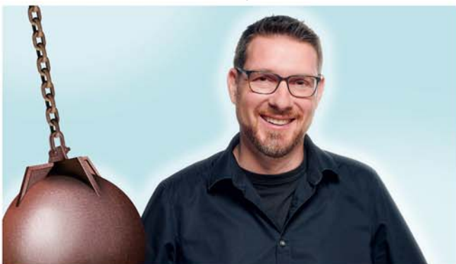
Comedian Sascha Thamm

Sascha Thamm tritt am 11. Februar 2025 um 20.00 Uhr mit seiner Comedy-Lesung „Gesammelte Abrissbirnen“ im Rahmen der „StadtHausSterne“ auf. Die Presse schreibt von einer „brachialen Pointendichte“ und „Schnappatmung beim Publikum“, das aus dem Lachen nicht mehr herauskommt. Wer einen lustigen Abend erleben möchte, ist bei Sascha Thamm bestens aufgehoben und sollte die Taschentücher für die Lachtränen nicht vergessen!