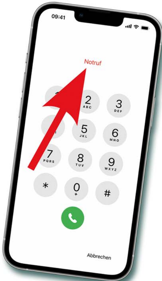
Notrufknopf im Sperrbildschirm

Es gibt Situationen, in die möchte man nicht kommen! Angenommen Sie stürzen. Sie sind nicht ansprechbar und bewegungsunfähig. Helfer sind vor Ort – aber sie benötigen Informationen. Sind evtl. Vorerkrankungen Ursache der Situation? Welche Medikamente werden eingenommen? Wer muss informiert werden? Sie selbst können die Fragen nicht beantworten – aber Ihr Smartphone kann es – wenn Sie vorgesorgt haben!