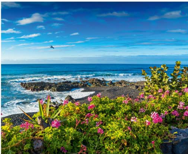
Lavastrand auf Teneriffa

Auf Teneriffa kann man in den Wintermonaten sowohl wandern als auch baden! Das milde Klima auf der Insel macht sie zu einem idealen Ziel für Outdoor-Aktivitäten. Die Temperaturen sind in der Regel angenehm, und die Landschaft bietet zahlreiche Wanderwege, darunter auch im Teide-Nationalpark, wo die Leser die beeindruckende Vulkanlandschaft erkunden können.