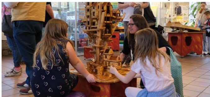
MURMILAND-Sonderausstellung im Stadtmuseum

Eintrittskarten sind ausschließlich an der Tageskasse erhältlich. Während der Jubiläumsausstellung hat das Stadtmuseum samstags und sonntags von 10.00 bis 18.00 Uhr sowie dienstags bis freitags von 15.00 bis 18.00 Uhr geöffnet.