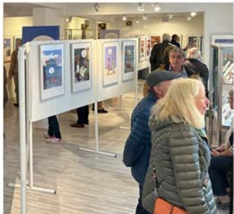
TETSCHÉ-Ausstellung in der KulturWerkStadt

Das Stadtmuseum (Schmiedestraße 6) zeigt die Ausstellung „Zeit – Takt im Räderwerk der Welt“, die sich mit der technischen und kulturellen Dimension der Zeitmessung auseinandersetzt. Zu den besonderen Exponaten gehört eine historische Turmuhr, die die Faszination traditioneller Uhrwerke lebendig werden lässt. Die Ausstellung ergänzen filigrane Kunstwerke, symbolische Darstellungen und weitere Objekte, die die Macht und Bedeutung der Zeit im gesellschaftlichen Kontext beleuchten. Verschiedene Uhrenmodelle von historischen Meisterwerken bis hin zu modernen Zeitmessern runden das Angebot ab. Der Eintritt ist frei. Die Ausstellung steht samstags und sonntags von 14.00 bis 17.00 Uhr für die Besucher offen. Eine Übersicht über das umfangreiche Beiprogramm enthält die Homepage www.vvvburgdorf.de .