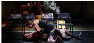
Theater für Niedersachsen

Samstag, 29. März, 13.00 bis 18.00 Uhr und