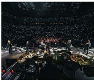
3. Burgdorf Open Air mit SANTIANO

Hauptsponsoren sind die Stadtsparkasse Burgdorf, E-CENTER-CRAMER, Hannoversche Volksbank, Stadtwerke Burgdorf GmbH, halsdorfer + ingenieure projekt gmbh, Ambulante Pflege Burgdorf, Baran GmbH, Dachtec GmbH & Co. KG, Electrotec GmbH, Baran Garten- und Landschaftsbau sowie die Baustoff Brandes GmbH. Als Veranstaltungspartner wirken der VVV und das JohnnyB. mit.