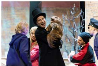
Musical „Und täglich grüßt das Murmeltier“

alles herrlich sein“ nach Sasha Marianna Salzmanns gleichnamigem Roman (25. April 2025) und zum Saisonabschluss am 23. Mai 2025 das Musical „Und täglich grüßt das Murmeltier“ von Tim Minchin und Danny Rubin nach der gleichnamigen zeitlos-witzigen Filmkomödie aus dem Jahr 1993. Dabei präsentiert die MusicalCompany des Theaters für Niedersachsen großartige Songs mit Ohrwurmcharakter, deren stilistische Bandbreite von Swing bis Pop reicht.