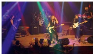
Jukebox Heroes im StadtHaus

Major (T-Rex). In einer auch visuell spektakulären Show spielen sie Songs dieser und weiterer Gruppen, unter anderem „Ballroom Blitz“ und „Fox on the run“ von Sweet, „Coz I Luv You“ und „My Oh My“ von Slade, „Bye Bye Baby“ von Bay City Rollers, „Angel Face“ und „Come on“ von der Glitterband, „Chicago Night Died“ und „Billy Don't Be A Hero“ von Paperplace sowie „Get it on“ und „Hot Love“ von T-Rex.