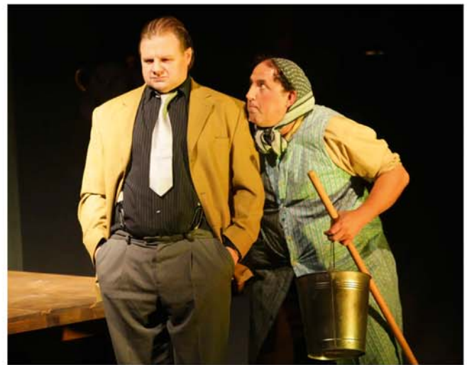
„Der ewige Spießler“ im Theater am Berliner Ring

Schauspiel nach dem gleichnamigen Roman von Ödön von Horváth Theater am Berliner Ring Veranstalter: VVV + Stadt Burgdorf Kartenvorverkauf: Bleich Drucken und Stempeln, Braunschweiger Str. 2, Tel.: 0 51 36 – 18 62, und www.reservix.de