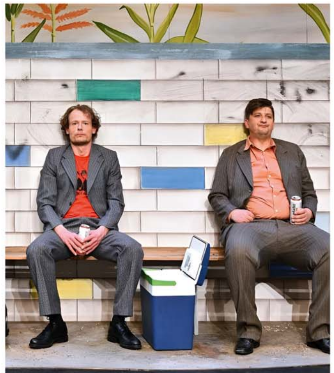
Komödie: „Warten auf'n Bus“

Komödie von Oliver Bukowski Theater am Berliner Ring Veranstalter: VVV + Stadt Burgdorf Kartenvorverkauf: Bleich Drucken und Stempeln, Braunschweiger Str. 2, Tel.: 0 51 36 – 18 62, und www.reservix.de