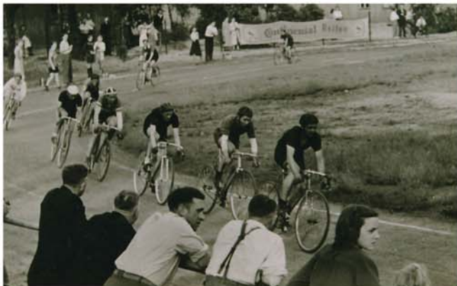
Ausstellung "Speed – schnelle Fahrräder": Aschenbahnrennen im Burgdorfer Stadion (Anfang der 1950er Jahre)

Um "Speed - schnelle Fahrräder" in unterschiedlichsten Varianten geht es bis zum 20. Oktober in einer neuen Schau der Radfahrgalerie Burgdorf. Zu ihrer Realisierung trug die Unterstützung durch die Hannoversche Volksbank und die Region Hannover bei. Die Schau lässt auch die Geschichte des Radsports in Burgdorf Revue passieren.