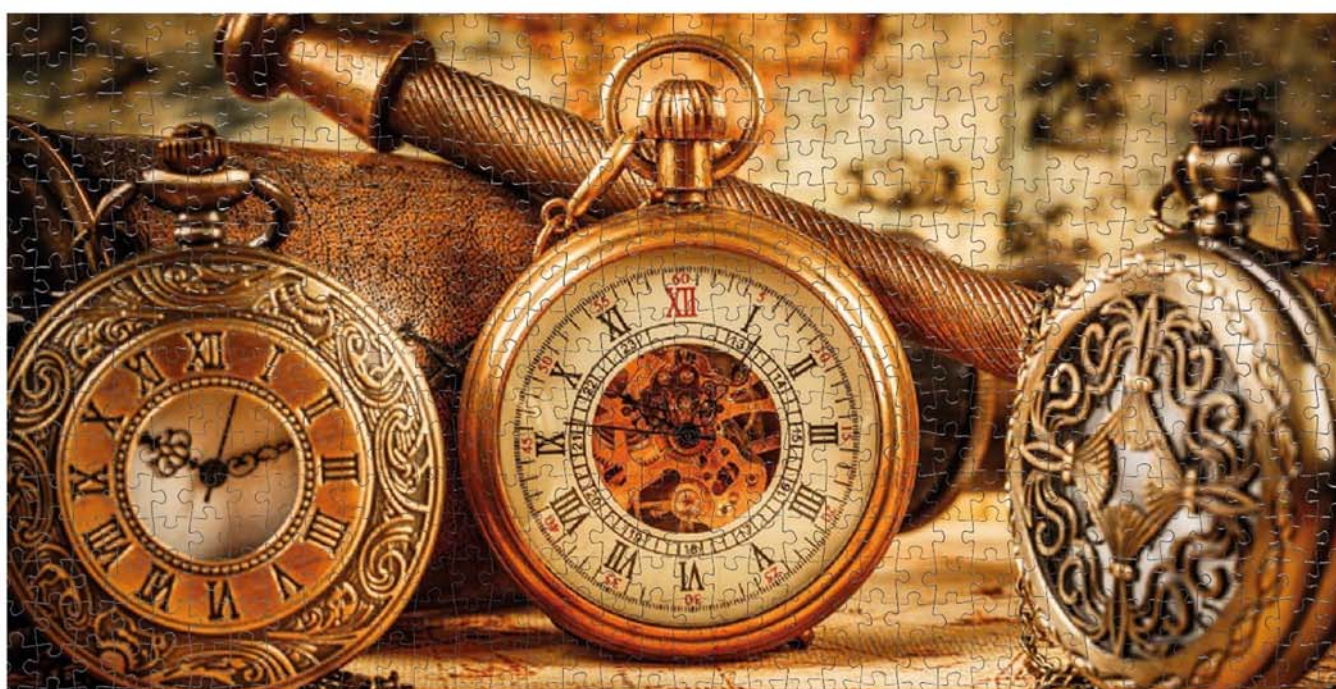
Ausstellung „Zeit – Takt im Räderwerk der Welt“