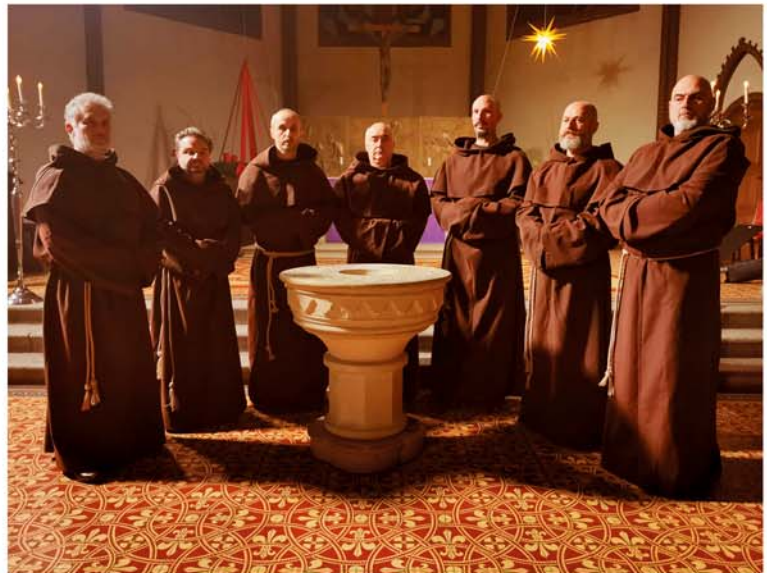
MAGIC GREGORIAN VOICES im StadtHaus