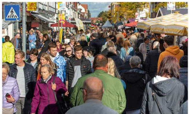
Besucherandrang beim Stadtfest Oktobermarkt

Der Großflohmarkt (Standkarten bei Bleich Drucken und Stempeln, Braunschweiger Str. 2) findet am Sonntag morgen in der Altstadt rund um die Schmiedestraße statt. Standkarten gibt es bei Bleich Drucken und Stempeln, Braunschweiger Str. 2, Tel. 05136 – 1862.