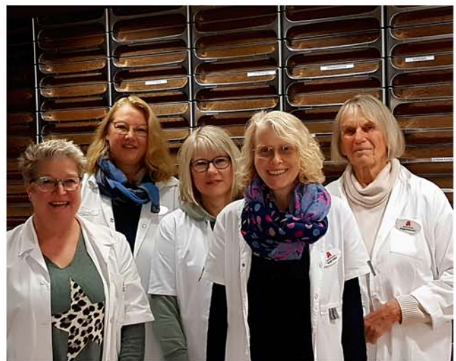
Die Mitarbeiterinnen der Neustadt-Apotheke

Wer sich außerhalb der Innenräume im direkten Einflussbereich der Sonne befindet, sollte – auch wenn es sich nur um einen kurzen Zeitraum handelt – vorher immer daran denken, für ausreichenden Sonnenschutz zu sorgen. Personen, bei denen so etwas schon mal aufgetreten ist, sollten unbedingt den Ratschlag beherzigen, den Körper an sehr kalten Tagen nicht mit zu intensiver sportlicher Aktivität zu belasten.