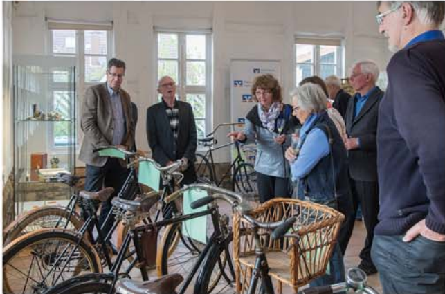
Ausstellung „Speed – schnelle Fahrräder“

Veranstalter: VVV + Förderverein Stadtmuseum + Stadt Burgdorf, Tel. 05136 - 1862