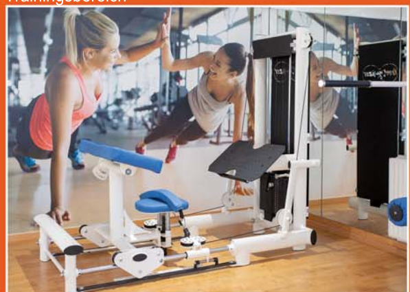
Getrennter Trainingsbereich (Lady-Fitness)