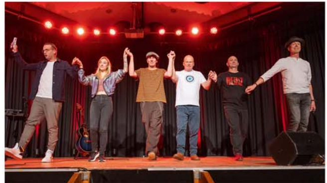
8. Burgdorfer Comedy-Nacht im StadtHaus

Veranstaltungszentrum StadtHaus, Sorgenser Str. 31 Veranstalter: StadtHaus Burgdorf in Zusammen- arbeit mit dem VVV, JohnnyB. und dem Verein für Kunst und Kultur in Burgdorf (VKK) Kartenvorverkauf: Bleich Drucken und Stempeln, Braunschweiger Str. 2, Tel. 05136 – 1862, und www.reservix.de