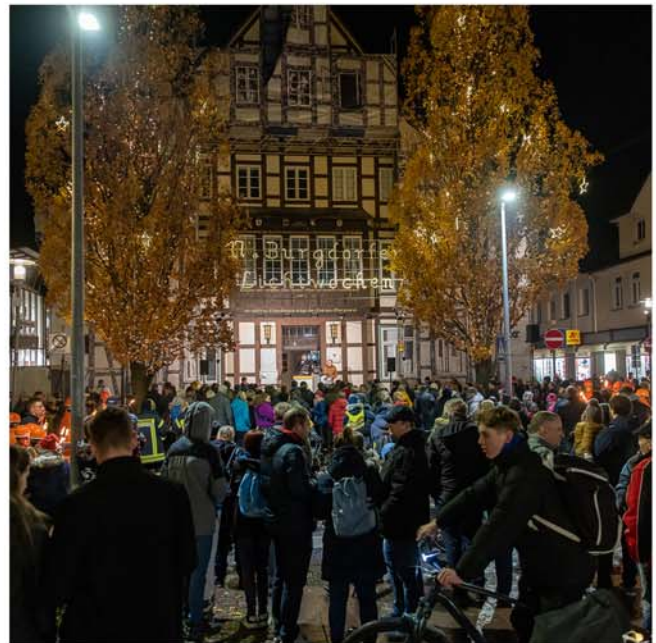
Eröffnung der 19. Burgdorfer Lichtwochen

Veranstalter: Stadtmarketing Burgdorf (SMB), Tel. 05136 – 972 14 18