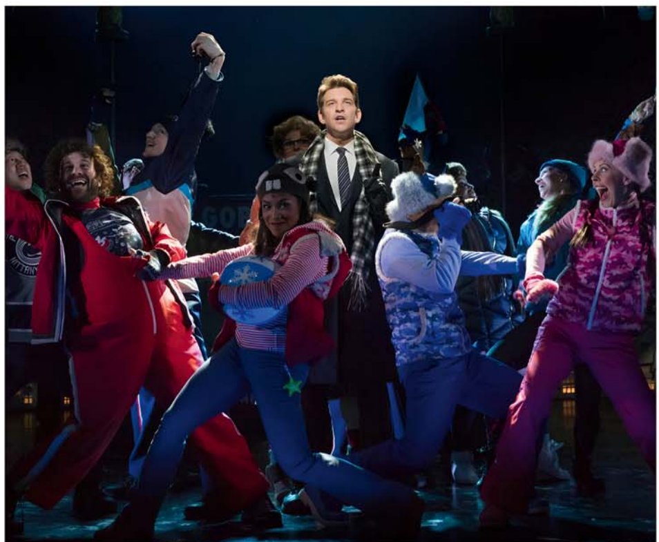
„Und täglich grüßt das Murmeltier“ im Theater am Berliner Ring