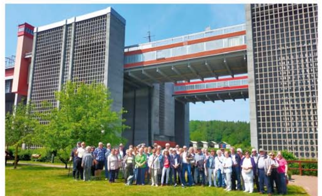
VVV Ü 50-Kulturfahrt zum Schiffshebewerk Scharnebeck