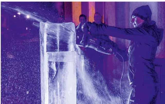
Eis-Performance zum Verkaufsoffenen Sonntag

Veranstalter: Stadtmarketing Burgdorf (SMB) Tel.: 05136 - 9 72 14 18