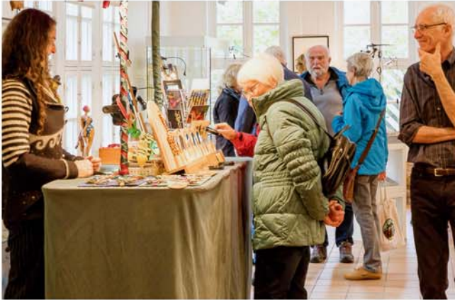
„Kunst und Handwerk“ im Stadtmuseum

Veranstalter: VVV + Förderverein Stadtmuseum