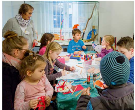
Experimentierausstellung in der KulturWerkStadt

denen fremde Lebewesen mit ihren Raumschiffen den Weltraum erobern.