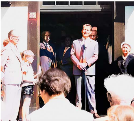
Ausstellung über die 1960er Jahre: Der damalige Regierende Bürgermeister von Berlin Willy Brandt hält bei seinem Burgdorf-Besuch am 30. Juni 1961 eine Rede auf der Treppe des historischen Rathauses in der Marktstraße

Auch in den Sommermonaten laden die vom VVV, der Stadt Burgdorf und dem Förderverein Stadtmuseum präsentierten, bei freiem Eintritt zugänglichen Ausstellungen im Stadtmuseum (Schmiedestraße 6) und in der KulturWerkStadt (Poststraße 2) zu einem längeren Besuch mit der ganzen Familie ein. Dieser lässt sich nachmittags ideal mit einem Spaziergang durch die Innenstadt kombinieren. Das Stadtmuseum ist samstags und sonntags von 14 bis 17 Uhr geöffnet. Die KulturWerkStadt öffnet sonntags von 14 bis 17 Uhr. Fördernde Unterstützung leisten die Stadtparkasse Burgdorf und die Region Hannover.