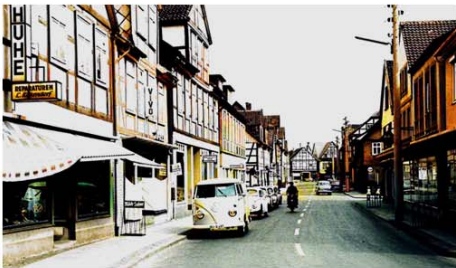
1960er Jahre-Ausstellung: Poststraße im Jahr 1962

Bis Sonntag, 4. August Ausstellung „Pop, Pille und Proteste – die 1960er Jahre“ Stadtmuseum, Schmiedestr. 6 Öffnungszeiten: Sonntag von 14 bis 17 Uhr Übersicht über das Beiprogramm auf www.vvvburgdorf.de Veranstalter: VVV + Förderverein Stadtmuseum + Stadt Burgdorf + Historisches Museum Hannover, Tel.: 05136 – 1862