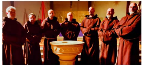
MAGIC GREGORIAN VOICES singen im StadtHaus

Das Ensemble verbindet die Gregorianik des Mittelalters mit geistlichen Liedern der Renaissance und des Barocks und interpretiert zudem Klassiker der Popmusik wie Leonard Cohens „Halleluja“ und Simon & Garfunkels „The Sound of Silence“. Bekannte Weihnachtslieder im stimmungsvollen A Cappella-Stil runden den Abend ab. Die Zuhörer erleben eine faszinierende Symbiose von Mittelalter und Gegenwart, bei der mächtige Stimmen und perfekte Vokalkunst für ein unvergessliches Konzerterlebnis sorgen.