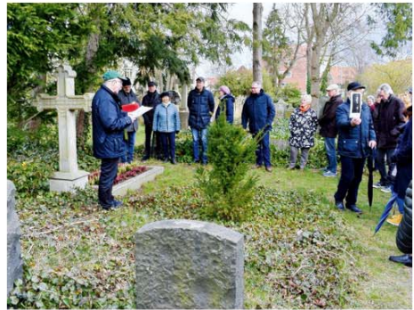
Stadtführung über den Magdalenenfriedhof

Sonntag, 7. Juli, 14 Uhr Öffentliche Stadtführung: Magdalenenfriedhof Treffpunkt: Magdalenenkapelle Veranstalter: Stadtmarketing Burgdorf (SMB), Kartenvorverkauf: Bleich Drucken und Stempeln, Braunschweiger Str. 2 Tel.: 05136 – 18 62