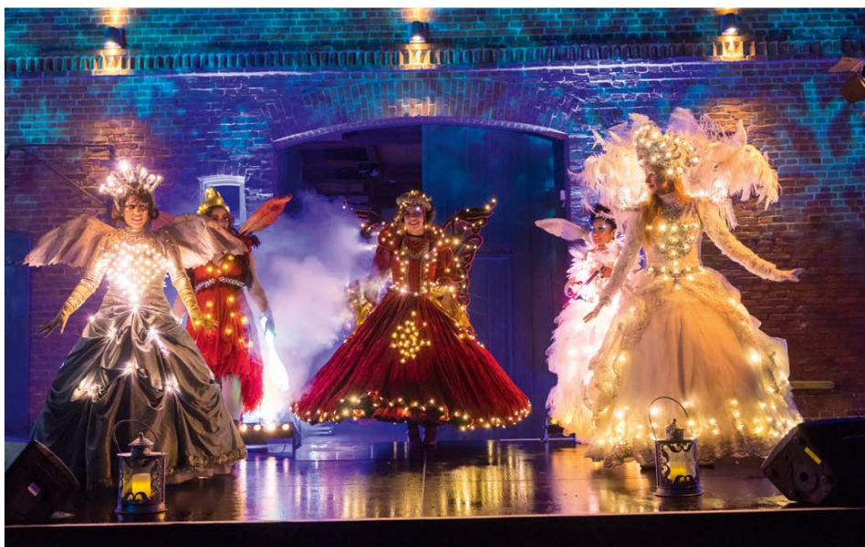
Lichterzauber am Schwanenteich

dem Kinder- und Jugendzirkus des JohnnyB.. Live-Musik kommt von 4totheBar mit leichtfüßigem Bossa Nova, entspannter Samba und coolem Swing, dem Jazz-Trio „Kognitive Dissonanz“ und der Trommelgruppe SambaZamba der Musikschule Ostkreis Hannover, die mitreißende brasilianische Rhythmen präsentiert.