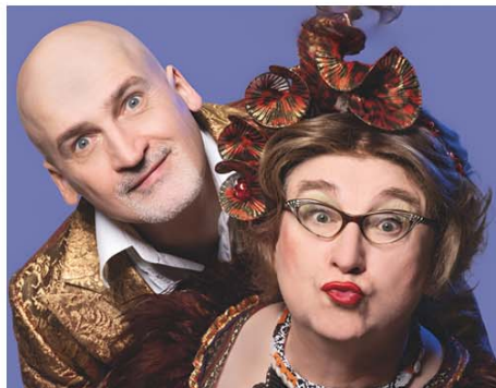
Comedy-Duo Emmi & Willnowsky

Duo „Emmi & Willnowsky“ zusammen und gelten als das „zärtlichste Paar der deutschen Comedy“. Sie sind regelmäßige Gäste auf allen bedeutenden Comedy-, Kabarett- und Varieté-Bühnen und in diversen TV-Formaten zu sehen. Auch dem Burgdorfer Publikum sind Emmi & Willnowsky bestens bekannt. Die Cuxhavener Zeitung schrieb über die beiden Künstler: „Ihre Wandlungsfähigkeit, ihre Spielfreude und vor allen Dingen ihre komischen Dialoge und Witze bescheren dem Publikum nur schwer kontrollierbare Lachanfälle.“