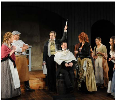
Musical-Thriller „Sweeney Todd – der teuflische Barbier von der Fleet Street“