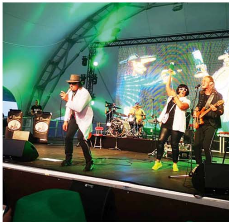
Livemusik auf dem Oktobermarkt mit „El Paniko und dem Katastrophenorchester“

Zum Oktobermarkt startet am 5. Oktober der 12. Burgdorfer