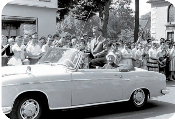
Ausstellung über die 1960er Jahre: Der damalige Regierende Bürgermeister von Berlin und spätere Bundeskanzler Willy Brandt besucht am 30. Juni 1961 Burgdorf

verzeichnen. Im Rahmen des aktuellen Themenjahres „Hier findet Leben Stadt! - 20 Jahre Stadtmarketing Burgdorf“ haben die Organisatoren wieder ein attraktives Programm zusammengestellt. Die Bandbreite reicht von einer Zeitreise in den 1960er Jahre bis zur TETSCHÉ-Cartoonausstellung. Das Stadtmuseum ist