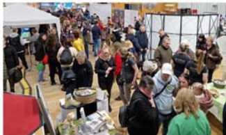
2. Hundemesse im StadtHaus

Zahlreiche Aussteller präsentieren sich auf der Messe mit ihren aktuellen Produkten, Dienstleistungen und Trends rund um das Hundewohl und eine artgerechte Hundehaltung. Das Angebotsspektrum reicht von Zubehör, Spielzeug, Pflegeprodukten und gesundem Futter über Tierphysiotherapeuten und Hundeschulen, die nähere Einblicke in ihre Tätigkeitsbereiche geben, bis zu einem Hundesport- und Tierschutzverein sowie Tierzeichnerinnen und –fotografen.