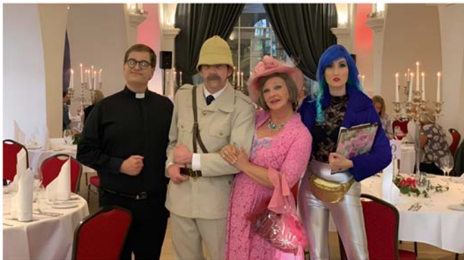
Krimi-Dinner im StadtHaus