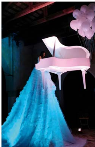
„Lange Nacht der Kultur“ u.a. mit fliegendem Piano

einer Krimi-Lesung bis zu Circusvorstellungen und einer Open-Air-Cartoonmeile reicht. Die Besucher erleben zudem ein fliegendes Piano mit einer Sängerin aus Italien.