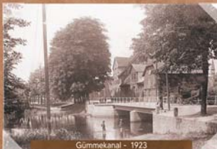
Gummekanal - 1923