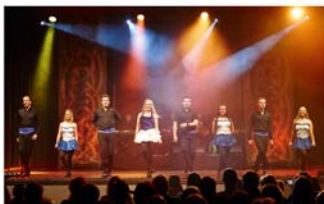
CELTIC RHYTHMS im StadtHaus

Scena – der Kulturverein im VVV, Kartenvorverkauf: Bleich Drucken und Stempeln, Braunschweiger Str. 2, Tel.: 0 51 36 – 18 62