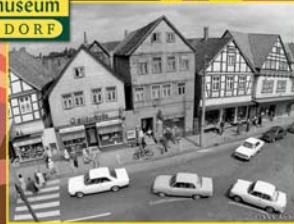
Burgdorfer Marktstraße 1969