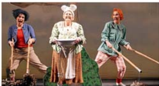
Schauspiel „Max und Moritz“

Freitag, 26. Januar, 20 Uhr Theater für Niedersachsen: „Max und Moritz“ Schauspiel nach Wilhelm Busch Theater am Berliner Ring Veranstalter: VVV + Stadt Burgdorf Kartenvorverkauf: Bleich Drucken und Stempeln, Braunschweiger Str. 2, Tel.: 0 51 36 – 18 62, und www.reservix.de