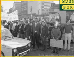
Rote Punkt-Aktion Juni 1969