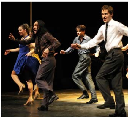
„Showtime“ im Theater am Berliner Ring

Am 23. Februar sind die Zuschauer der Musical-Gala „Showtime“ eingeladen, zu einer Reise durch die Musicallyandschaft des frühen zwanzigsten Jahrhunderts aufzubrechen. Dabei können sie sich von romantischen Balladen verzaubern lassen und erleben großartige Jazznummern zum Mitswingen. Unvergessene Melodien aus der musikalischen Schatztruhe von Cole Porter, George Gershwin, Leonard Bernstein und anderen Broadway-Legenden teilen sich mit selten zu hörenden Raritäten die Bühne und lassen den Showglanz früherer Zeiten wiederaufleben.