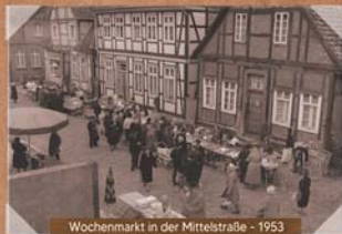
Wochenmarkt in der Mittelstraße - 1953