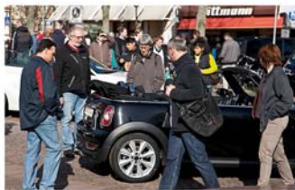
Auto-Frühling in der Innenstadt