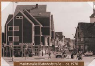
Marktstraße/Bahnhofstraße - ca. 1970