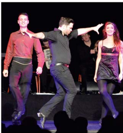
„CELTIC RHYTHMS direct from Ireland“

Die Zuschauer erleben rasante und temporeiche Stepptänze und eine kraftvolle Performance mit stürmischer und begeisternder Irish Folk Music. Diese Show ist tief verwurzelt in der irisch-keltischen Tradition, gepaart mit modernen Elementen und vereint die besten Tänzer und Musiker der Insel. Authentische jahrhundertalte Tradition trifft bei dieser außergewöhnlichen Show auf moderne, kreative und aktuelle Tanzchoreographien.