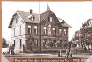
Postamt Vor dem Hannoverschen Tor - 1905