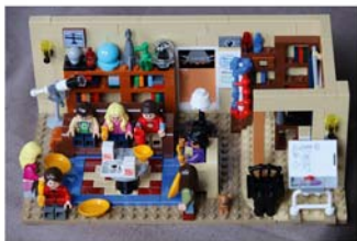
LEGO®-Ausstellung im Stadtmuseum

Filmen und Serien“: u.a. „Herr der Ringe™“, „The Hobbit™“, „Ghostbusters™“, „Batman™“ und „Brick Headz™“.