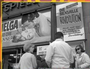
Regina Lichtspiele in Hannover, Werbung für „Helga und die Männer“ (27. Mai 1969)