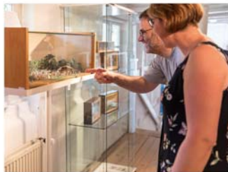
Zinnfigurenausstellung in der KulturWerkStadt

Samstag, 23. März, 13 bis 18 Uhr und Sonntag, 24. März, 11 bis 18 Uhr