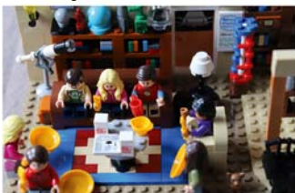
LEGO®-Ausstellung im Stadtmuseum

Stadtmuseum, Schmiedestr. 6 Öffnungszeiten: Sonntag von 14 bis 17 Uhr Stadtmarketing Burgdorf + VVV + Förderverein Stadtmuseum + Stadt Burgdorf, Tel.: 0 51 36 – 18 62