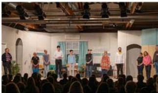
Aufführung des VVV-Theaters 2022

Für VVV-Mitglieder gibt es im Vorverkauf Ermäßigungen. Das Theaterstück unterliegt keiner Altersbeschränkung. Da es aber zwei bis drei etwas frivole Szenen gibt, empfiehlt das Ensemble für den Besuch der Aufführungen ein Mindestalter von 16 Jahren.