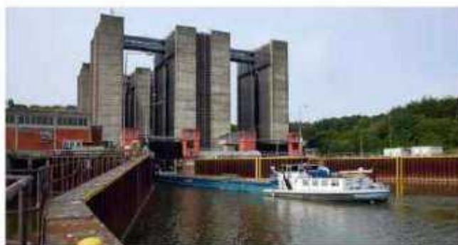
Kulturfahrt zum Schiffshebewerk Scharnebeck

Auf dem Tagesprogramm steht zunächst eine Führung durch das Doppelsenkrecht-Schiffshebewerk in Scharnebeck, das das Größte seiner Art in Deutschland ist. Es entstand in achtjähriger Bauzeit im Elbe-Seitenkanal, nahm 1976 den Betrieb auf und überwindet einen Höhenunterschied von 38 Metern. Zudem steht ein Rundgang durch das dazu gehörige Museum auf dem