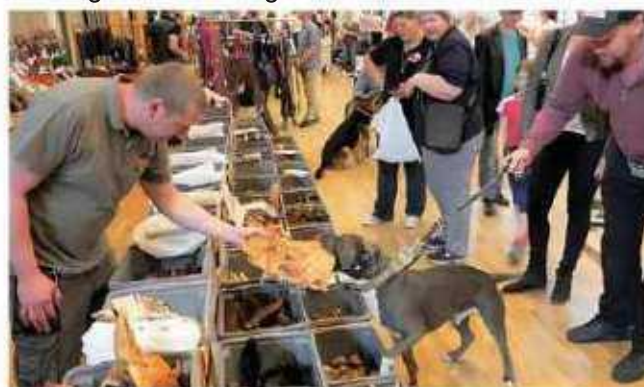
2. Hundemesse im StadtHaus

Ausstellern ins Gespräch zu kommen und deren professionelle Beratung in Anspruch zu nehmen. Im Mittelpunkt der Messe stehen alle Themen rund um den „besten Freund des Menschen“. Die Besucher sind eingeladen, sich an den Ständen über Pflege-mittel, Spielzeug, Zubehör (Halsbänder, Näpfe, Transportboxen, Körbchen usw.) und die Wahl von gesundem und artgerechtem Futter zu informieren und gewünschte Artikel zu erwerben. Ein Schwerpunktthema ist die Hundeerziehung und Tiergesundheit. Welche Möglichkeiten bietet eine Hundeschule, um das manchmal zu ungestüme Verhalten der Tiere in die richtige Richtung zu lenken? Wie trägt Hundesport zum körperlichen Wohlbefinden der Tiere bei? In welchen Situationen kann Hundephysiotherapie die Beschwerden eines körperlich beeinträchtigten Tieres lindern? Auf diese und viele andere Fragen erhalten die Hundebesitzer hilfreiche Antworten, die dazu beitragen, dass ihr vierbeiniger Liebling davon nachhaltig profitiert und alle Voraussetzungen für ein langes Hundeleben erfüllt.