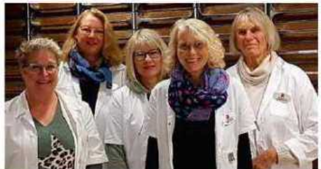
Die Mitarbeiterinnen der Neustadt-Apotheke

Die Winterzeit ist allgemein immer wieder von neuem eine Strapaze für die Haut. Heizungsluft und Kälte machen Haut und Lippen spröde und rissig. Hier kann die entsprechende Pflege Abhilfe schaffen. Wie man dabei vorgehen sollte, erfahren unsere Kunden bei einer individuellen Beratung durch unser Team. In seinem persönlichen Umfeld hat sicher jeder Leser bemerkt, dass die Erkältungszeit noch in vollem Gang ist. Wer unter unangenehmem Husten leidet, kann Thymian als Tee oder pflanzliche Präparate mit Thymian oder Efeu einnehmen. Sie können nachhaltige Erfolge zur Linderung der Beschwerden erzielen. Auch die Schüssler Salze sind dazu geeignet, das Immunsystem zu stärken und zum Beispiel Erleichterung bei Kopfschmerzen zu verschaffen.