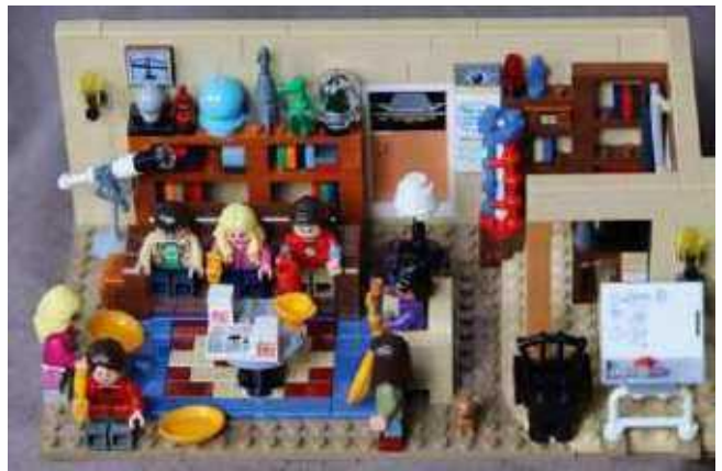
LEGO®-Ausstellung im Stadtmuseum