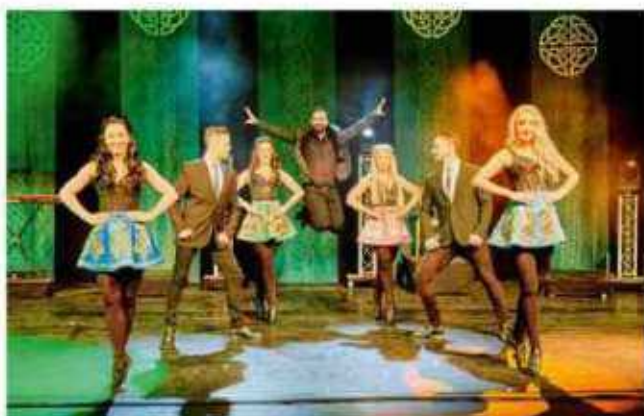
Irische Tanzshow im StadtHaus

Zu einem irischen Abend voller Lebenslust, rhythmischer Dynamik, tänzerischer Ausdruckskraft und traumhaft schöner keltischen Melodien lädt das Veranstaltungszentrum StadtHaus (Sorgenser Straße 31) am Mittwoch, 14. Februar 2024, um 20.00 Uhr ein. Im Mittelpunkt steht die Tanzshow „CELTIC RHYTHMS direct from Ireland“. Gastgeber ist das StadtHaus Burgdorf. Eintrittskarten sind bei Bleich Drucken und Stempeln, Braunschweiger Straße 2, Telefon 05136 – 1862, und online unter www.reservix.de erhältlich.