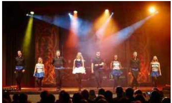
CELTIC RHYTHMS im StadtHaus

Kartenvorverkauf: Bleich Drucken und Stempeln, Braunschweiger Str. 2, Tel.: 0 51 36 – 18 62, und www.reservix.de