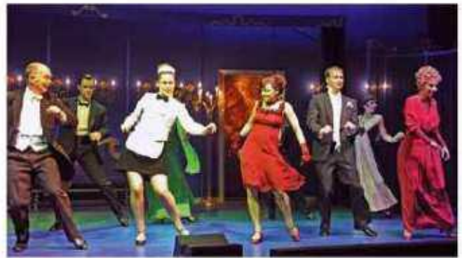
„Showtime“ im Theater am Berliner Ring

der katholischen Kirche in Deutschland. Seitdem geraten regelmäßig weitere solcher Fälle in die Schlagzeilen. Ausgehend von Interviews, Zeitungsartikeln und Reportagen begibt sich eine Gruppe von Schauspielern mit ihrer Regisseurin auf eine Spurensuche. Sie suchen nach Antworten, wie es soweit kommen konnte, welche Rolle Veruschung dabei spielt und inwieweit das Vertrauen in die Glaubwürdigkeit der Kirche einen irreparablen Schaden davonträgt, der sich äußerlich in nie einer dagewesenen Zahl von Kirchnaustritten widerspiegelt?