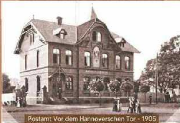
Postamt Vor dem Hannoverschen Tor - 1905