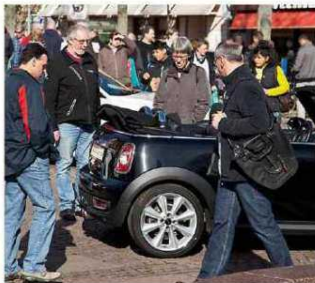
Auto-Frühling in der Innenstadt