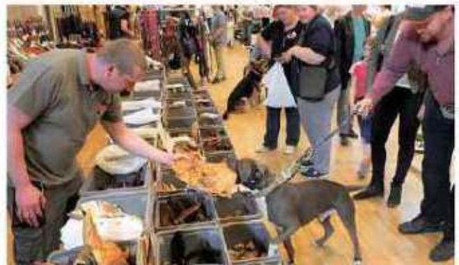
2. Burgdorfer Hundemesse

Veranstaltungszentrum StadtHaus, Sorgenser Str. 31 Veranstalter: StadtHaus Burgdorf, Tel. 05136 – 972 14 18