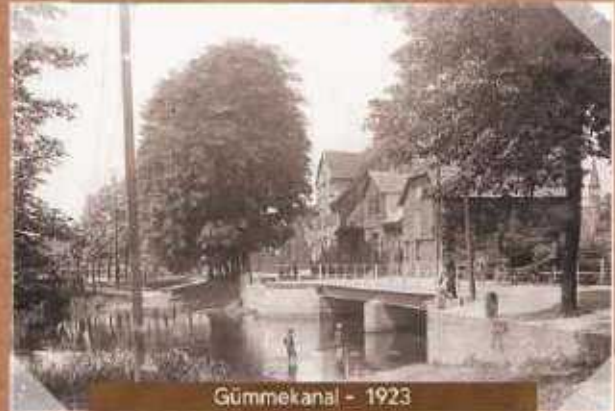
Gümme kanal - 1923