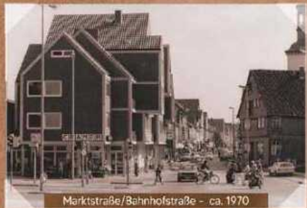
Marktstraße/Bahnhofstraße - ca. 1970