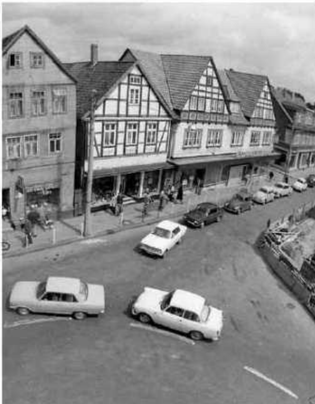
Ausstellung über die 1960er Jahre: Marktstraße/ Ecke Poststraße 1969

Veranstalter: VVV + Förderverein Stadtmuseum + Stadt Burgdorf, Tel. 05136 – 1862