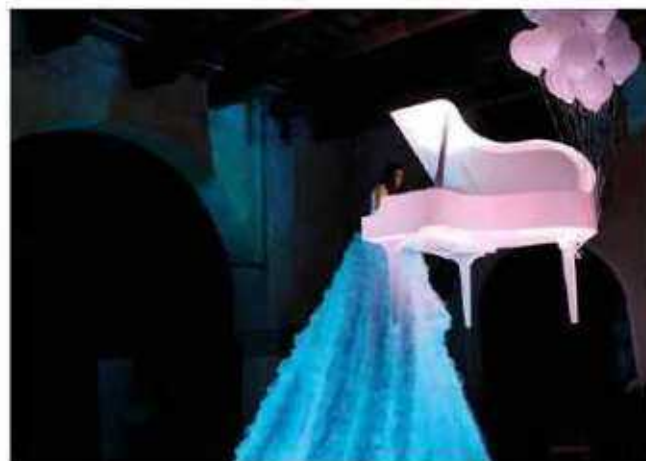
„Lange Nacht der Kultur“ mit einem fliegenden Piano

reicht. Die Besucher werden zudem Augen- und Ohrenzeugen eines besonderen Spektakels: Ein fliegendes Piano mit einer Sängerin aus Italien schwebt über dem Spittaplatz.