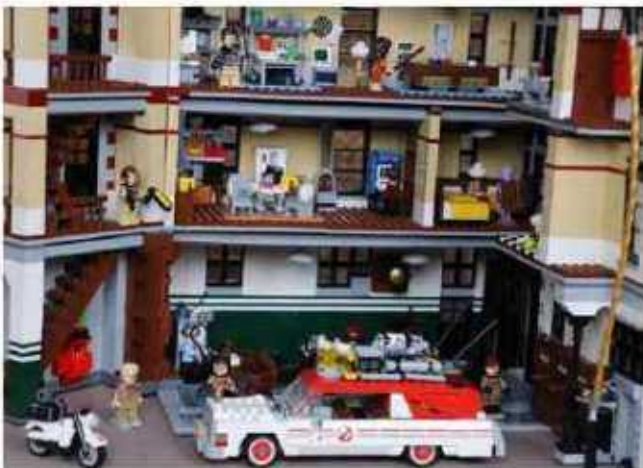
LEGO®-Ausstellung im Stadtmuseum

Bis zum 28. Januar zeigt das Stadtmuseum (Öffnungszeiten: samstags und sonntags von 14.00 bis 17 Uhr die Günter Grass-Sonderausstellung, zu der ein umfangreiches Beiprogramm gehört. Der dazu gehörige Flyer steht auf der Homepage www.vvvburgdorf.de zum Download bereit. „Hier findet Leben Stadt! – 20 Jahre Stadtmarketing Burgdorf“ lautet der Titel der sich anschließenden gleichnamigen Schau, die im Erdgeschoss vom 18. Februar bis 7. April die nun schon zwei Jahrzehnte umfassende Erfolgsgeschichte des Netzwerks für Wirtschaft und Gesellschaft Revue passieren lässt, aber auch viele Einblicke in die gegenwärtigen Aktivitäten des Vereins gibt. Zum Beiprogramm gehört u.a. eine Ehrenamts-Börse am 3. März. Im Obergeschoss erleben die Museumsbesucher zur gleichen Zeit eine neue LEGO®-Ausstellung von Christian Lange. Sie umfasst die Themenbereiche „Modelle aus Filme und Serien“, „Herr der Ringe™“, „The Hobbit™“, „Ghostbusters™“, „Batman™“ und „Brick Headz™“.