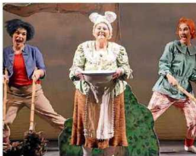
Schauspiel „Max und Moritz“

Kartenvorverkauf: Bleich Drucken und Stempeln, Braunschweiger Str. 2, Tel.: 0 51 36 – 18 62, und www.reservix.de