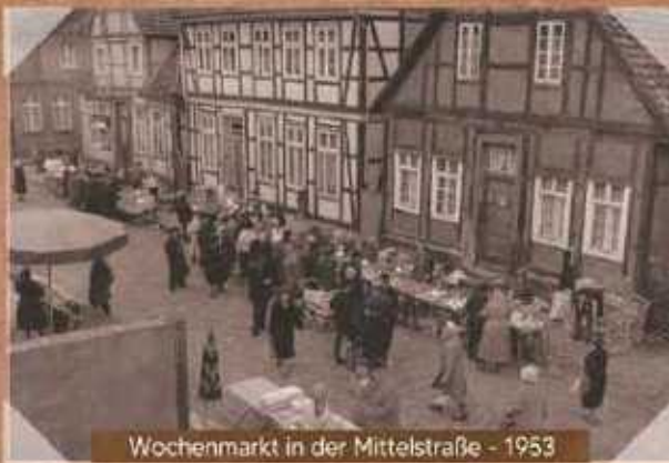
Wochenmarkt in der Mittelstraße - 1953