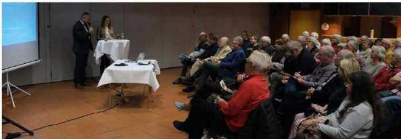
Vortrag über Cyberkriminalität im StadtHaus