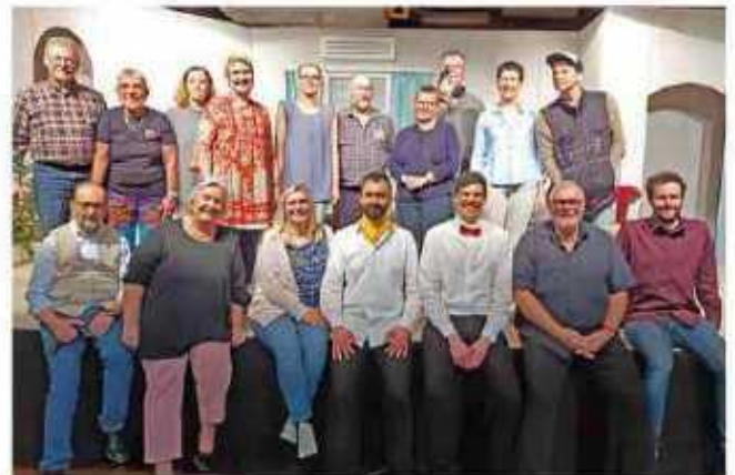
VVV-Theater spielt neue Komödie

von Lewis Easterman Weitere Vorstellungen am 20.4., 26.4., 27.4. um 19.30 Uhr, am 21.4. um 15.00 Uhr (Kaffee und Kuchen) Theatersaal des JohnnyB., Sorgenser Str. 30 Veranstalter: VVV-Theater Kartenvorverkauf: Bleich Drucken und Stempeln, Braunschweiger Str. 2, Tel.: 0 51 36 – 18 62