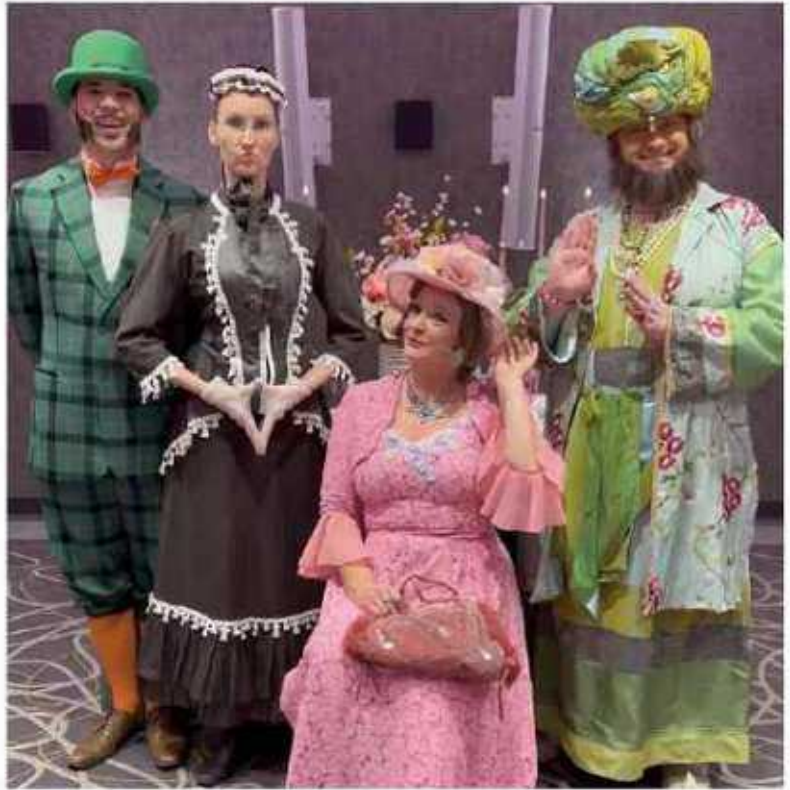
Krimi-Dinner im StadtHaus

Beim aktuellen 4-Gänge-Dinner-Menü besteht die Auswahl zwischen einer beim Ticketkauf buchbaren klassischen oder vegetarischen Variante. Der Einlass beginnt um 18.30 Uhr. Eintrittskarten sind bei Bleich Drucken und Stempeln, Braunschweiger Straße 2, Telefon 05136 - 1862, und im Onlineportal www.reservix.de erhältlich.