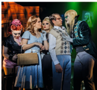
Musical „The Rocky Horror Show“

Die 1973 seine Premiere feiernde und seitdem zum Kult-Musical aufgestiegene „Rocky Horror Show“ nimmt am 3. November das Publikum auf eine geheimnisvolle Reise mit: Es scheint eine ganz normale Nacht zu sein, als Brad Majors und seine Verlobte Janet