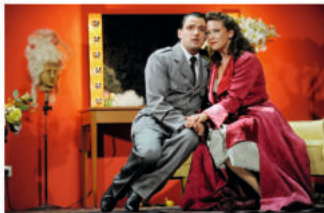
Schauspiel "Sein oder Nichtsein"

Freitag, 15. Dezember, 20 Uhr Theater für Niedersachsen: „Sein oder Nichtsein“