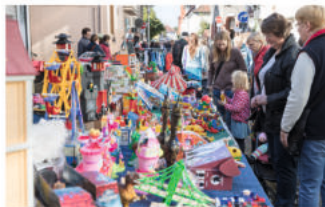
Großflohmarkt in der Altstadt

Braunschweiger Str. 2) findet am Sonntag morgen in der Altstadt rund um die Schmiedestraße (Willersgasse, Schmiedestraße, Kleine Bergstraße, Wallstraße und Bergstraße) statt. Standkarten gibt es bei Bleich Drucken und Stempeln, Braunschweiger Str. 2, Tel. 05136 – 1862.