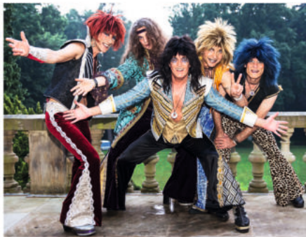
SWEETY GLITTER & THE SWEETHEARTS

Green River Gang (Creedence Clearwater Revival Band) und die Marius Müller-Westernhagen Cover-Band „Mit 18“ erweisen am selben Abend zwei Ikonen der amerikanischen und deutschen Rockmusik ihre musikalische Reverenz.