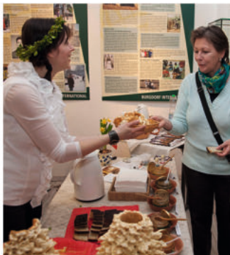
Länder-Infotage in der KulturWerkStadt

Bis zum Abschluss der Ausstellung gibt es an jedem Sonntag Länder-Infotage, den die in der Schau portraitierten Persönlichkeiten organisieren. Das Jahresprogramm endet ab dem 26. November mit der Ausstellung „Museumsschätze – ein Blick in das Gedächtnis unserer Stadt“.