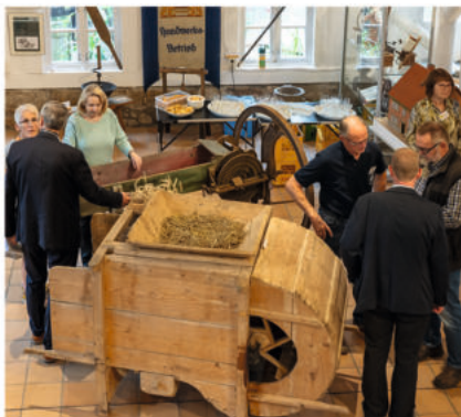
Ausstellung „Burgdorfer Schätze“

Die 22. Auflage der Verkaufsausstellung „Kunst und Handwerk“ zieht am 4. und 5. November erneut die Anhänger stilvoll und individuell gestalteten Kunsthandwerks an. Das Jahresprogramm im Stadtmuseum endet mit einer Günter Grass-Ausstellung. Sie erinnert vom 18. November bis zum 28. Januar 2024 an das Lebenswerk des streitbaren Schriftstellers.