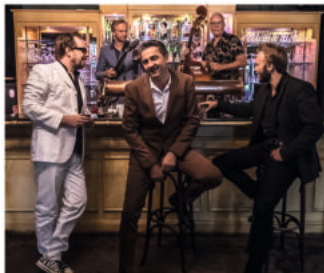
B.B. & The Blues Shacks

Freitag, 17. November, 20 Uhr Konzert mit B.B. & The Blues Shacks