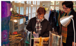
Kunst & Handwerk im Stadtmuseum

Samstag und Sonntag, 4. und 5. November, 11 - 18 Uhr Verkaufsausstellung „Kunst & Handwerk“ Stadtmuseum, Schmiedestr.6 Veranstalter: VVV + Stadt Burgdorf, Tel.: 05136 – 1862