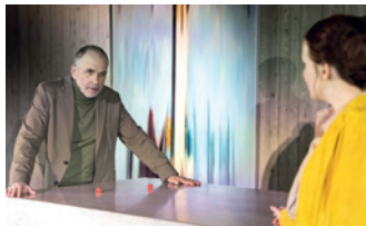
Schauspiel „Der Teufel und der liebe Gott“

Schauspiel von Jean-Paul Sartre Theater am Berliner Ring, Berliner Ring 27 Veranstalter: VVV + Stadt Burgdorf Karten: Bleich Drucken und Stempeln, Braunschweiger Str. 2, Tel.: 05136 – 1862 und www.reservix.de