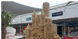
„SandCity“ auf dem Spittaplatz

dann den Sandkünstlern von bequemen Sonnenstühlen aus bei der Arbeit zuschauen kann. Zum Verkaufsoffenen Sonntag am 7. Mai sind alle Kinder zu einem Sandburgen-Wettbewerb eingeladen. Höhepunkt an diesem Tag ist die Präsentation der fertig gestellten Skulptur. Hauptsponsoren des Events sind die Stadtparkasse Burgdorf und die Gustav Lehmann Mörtel-, Sand- und Kieswerke GmbH.