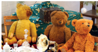
Die „große Teddy-Schau“ im Stadtmuseum

Stadtmuseum, Schmiedestr. 6 Öffnungszeiten: Sonntag von 14.00 bis 17.00 Uhr Veranstalter: VVV + Förderverein Stadtmuseum + Stadt Burgdorf Tel.: 0 51 36 – 18 62