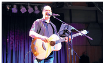
MitSing-Party im CulturCircus

Freitag, 16. Juni, 20.00 Uhr CulturCircus: 3. MitSing-Party Schlosspark Veranstalter: StadtHaus Burgdorf, VVV, JohnnyB. und Verein für Kunst und Kultur in Burgdorf (VKK) Kartenvorverkauf: Bleich Drucken und Stempeln, Braunschweiger Str. 2, Tel. 05136 - 1862 + www.reservix.de