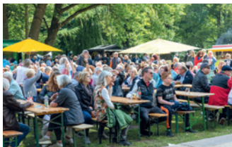
„Musik und Tanz im Stadtpark“

modernen Schlagern sowie Oldies und Popclassics. Auf dem Areal der Tanzfläche im Umfeld des Schwanenteichs erwartet die Gäste ein Angebot an Imbiss- und Getränkemöglichkeiten. Das Studio B5 organisiert ein kurzweiliges Mitmachprogramm für Kinder. Zudem gibt es die Gelegenheit zum Bungee-Trampolinspringen, zum Austoben auf einer Riesenhüpfburg und zum Auftragen von Glitzer-Tattoos.