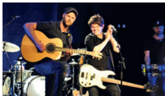
2. Burgdorf Open Air mit Michael Patrick Kelly

Tickets sind bei allen bekannten Vorverkaufsstellen (in Burgdorf: Bleich Drucken und Stempeln, Braunschweiger Straße 2, Tel 05136 – 1862, HAZ/NP/Marktspiegel-Geschäftsstelle, Marktstraße 16 und im E-CENTER-Cramer, Weser- und Uetzer Straße) erhältlich. Karten für Stehplätze kosten 65 Euro. Einen Rundum-Konzert-Genuss bietet das VIP-Ticket für 220,10 Euro, in dem unter anderem eine Flatrate für Getränke und Büfett im VIP-Zelt enthalten ist.