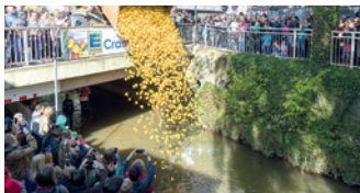
Entenrennen auf der Aue

Hauptgewinn winkt ein vom Marktspiegel gestifteter BURGDORFER GESCHENKGUTSCHEIN im Wert von 1.000 Euro. Teilnahmekarten gibt es hier: E-CENTER-CRAMER (Weserstr. 2a und Uetzer Str. 14-15), HAZ/ NP/Marktspiegel (Marktstr. 16), NEUE WOCHE (Hannoversche Neustadt 4-5) und Bleich Drucken und Stempeln (Braunschweiger Str. 2).