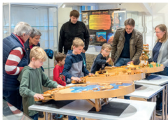
Murmelbahn-Mitspielausstellung am 2. April und 7. Mai

Im Anschluss an die Jubiläumsschau startet am 28. Mai die „große Teddy-Schau“, die bis zum