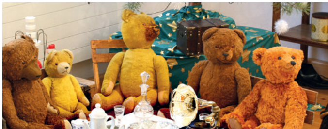
Die „große Teddy-Schau“ im Stadtmuseum