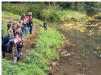
Entenrennen auf der Aue

Auebrücke, Poststraße Veranstalter: Stadtmarketing-Initiative „Ich kauf in Burgdorf“ + E-CENTER-CRAMER + Verein für Kunst und Kultur in Burgdorf Teilnehmerkarten: Bleich Drucken und Stempeln, Braunschweiger Str. 2 + E-CENTER-CRAMER (Weserstraße 2a und Uetzer Str. 14-15) + HAZ/ NP/Marktspiegel (Marktstr.16)