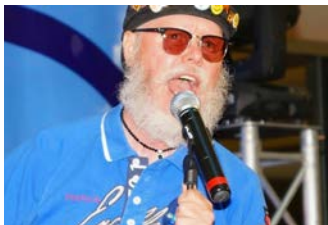
Mit Harpo tritt eine Schlagerlegende beim Stadtfest auf

punkten des Musikprogramms. Mit dem schwedischen Sänger Harpo (Hits: „Movie Star“, „Motorcycle Mama und „Horoscope“) tritt eine seit den 1970er Jahren bekannte Schlagerlegende auf. An die „Neue Deutsche Welle“ und deren unver- gessene Hits erinnert die Band „Achtung 80!“.