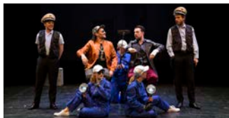
Musical "Knockin' on heaven's door"