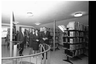
Ausstellung zum 90-jährigen Bestehen der Stadtbücherei Burgdorf

Sonntag, 23. Oktober, bis Sonntag, 11. Dezember Ausstellung „Kann man das ALLES aus- leihen? — Stadtbücherei Burgdorf“ KulturWerkStadt, Poststr. 2 Öffnungszeiten: Sonntag von 14 bis 17 Uhr Veranstalter: VVV + Förderverein Stadtmuseum + Stadtbücherei Burgdorf, Tel.: 05136 - 18 62