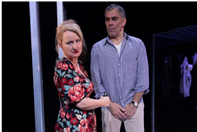
Komödie „Offene Zweierbeziehung“

Theaterfreunde können die Auswahl zwischen vier Abo-Kategorien treffen: „MARATHON“ (acht Vorstellungen, Gesamtpreise von 78 bis 132 Euro), „WAHL-ABO“ (fünf Vorstellungen zur freien Auswahl, Gesamtpreise von 65,50 bis 92,00 Euro), „CLASSICO“ (vier Vorstellungen klassischen Inhalts, Gesamtpreise von 37,00 bis 64 Euro)