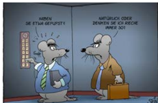
Große Uli Stein-Schau im Stadtmuseum

Freitag, 30. September bis Sonntag, 2. Oktober