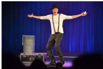
6. Burgdorfer Comedy-Nacht im StadtHaus (u.a. mit Herrn Niels)

Veranstaltungszentrum StadtHaus (Sorgenser Straße 31) Veranstalter: StadtHaus + VVV + JohnnyB. + Verein für Kunst und Kultur in Burgdorf Karten- vorverkauf: Bleich Drucken und Stempeln, Braunschweiger Str. 2, Tel. 05136 - 1862, und www.reservix.de