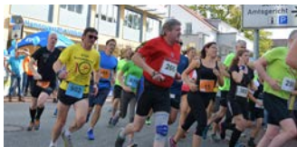
10 Jahre Burgdorfer Spargel-Lauf