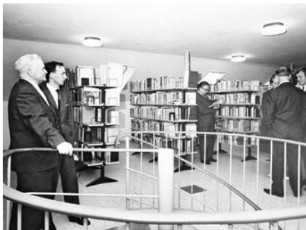
Ausstellung zum 90-jährigen Bestehen der Stadtbücherei

Vom 18. Dezember bis zum 25. Februar 2023 folgt die kulturgeschichtliche Ausstellung „Der Drogerhändler - 100 Jahre Drogeriegeschichte“ (18. Dezember bis 25. Februar 2023).