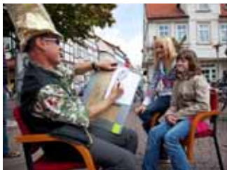
38. Kunstmarkt am 4. September