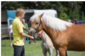
20. August: 219. Pferde- und Hobbytiermarkt und City-Samstag

City-Samstag zum Pferde- und Hobbytiermarkt