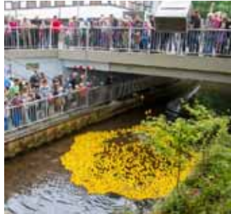
17. September: 5000 Enten schwimmen auf der Aue um die Wette.

Samstag, 17. September, 11.30 Uhr Entenrennen auf der Aue Veranstalter: Stadtmarketing-Initiative „Ich kauf‘ in Burgdorf“ und E-CENTER-CRAMER Teilnehmekarten: E-CENTER-CRAMER (Weserstraße 2 und Uetzer Straße 14-15), MARKTSPIEGEL (Marktstraße 16) und Bleich Drucken und Stempeln (Braunschweiger Straße 2) sowie bei allen Pferde- und Hobbytiermärkten