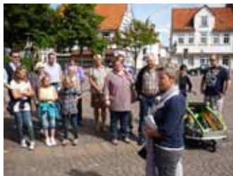
11. September: Stadtführung zur Kriminalgeschichte

Veranstalter: Stadtmarketing Burgdorf e.V.