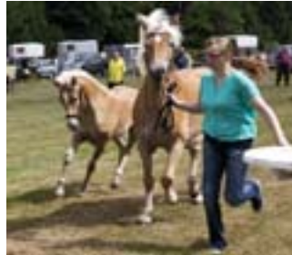
Auftakt zu den Pferde- und Hobbytier- märkten 2014 ist am 19. April.

Kulturfahrt zur „gläsernen Wurstproduktion“ nach Versmold Schützenplatz Veranstalter: VVV Ü 50 - Club für aktive