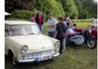
Pferde- und Hobbytiermarkt mit Oldti- mer-Treffen ist am 17. Mai.

204. Pferde- und Hobbytiermarkt Pferdemarktplatz / Kleiner Brückendamm Veranstalter: VVV + Verein Burgdorfer Pferdeland