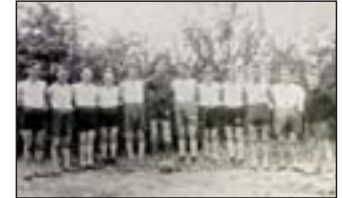
Die 3. Handball-Mannschaft der Freien Turnerschaft Burgdorf stellte sich 1927 zum Foto auf.

Zu einer Hochkonjunktur des Ehrenamts kam es Anfang des 20. Jahrhunderts, die sich auch in