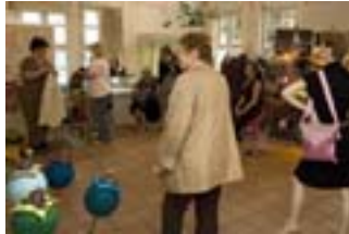
Ende April gehört das Stadtmuseum den Damen.

Ziel ist es, Unternehmerinnen zu fördern, eine Plattform zur Präsentation zu bieten und den Ausbau von Netzwerken zu unterstützen. Zum Programm gehören Vorträge und Aktionen der Aussteller, Mitmachaktionen für Kinder, Modenschauen und das Museumscafé.