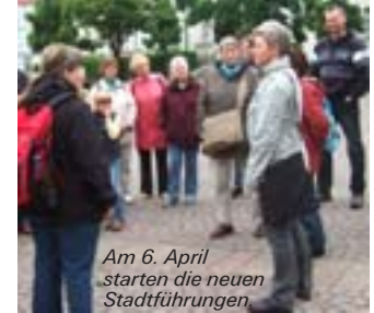
Am 6. April starten die neuen Stadtführungen

Öffentliche Stadtführung: Klassischer Rundgang Treffpunkt: Wicken-Thies-Brunnen / Spittaplatz Veranstalter: Stadtmarketing Burgdorf e.V. Teilnehmerkarten: Bleich Drucken und