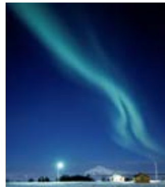
Tolles Erlebnis: Polarlichter.

Als plastisches visuelles Erlebnis, welches im Bereich der Live-Reportage einzigartig im deutschsprachigen Raum ist, kündigt der Fotograf Stephan Schulz seine Dia-Show „Island – Insel der Naturgewalten“ an, die am Dienstag, 21. Januar, ab 19.30 Uhr im Theatersaal des Johnny B. (Sorgenser Straße 30) in einer digitalen 3D-Projektion zu sehen ist.