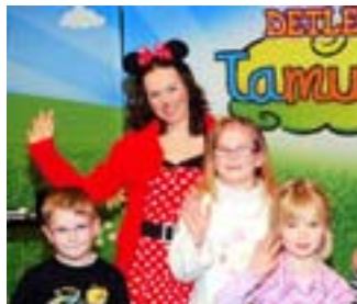
Kinderglück mit Liedermaus.

großen Zuschauer zum Singen, Tanzen und Bewegen animieren. Als sympathische Bühnenpartnerin steht Jöcker die Si-Sa-Singemaus zur Seite, die ihn bereits seit vier Jahren auf seinen Tourneen begleitet. Neben zahlreichen neuen Spiel- und Spaßliedern erklingen im Konzert bekannte und beliebte Ohrwürmer, darunter „Das Minimonster Lied“ oder „Tanz mit der Si-Sa-Singemaus“.