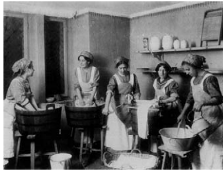
Aus der Ausstellung „Waschen – Baden – Putzen: Sauberkeit im Wandel der Zeit“.

jahres „ Burgdorf: Hier findet Ehrenamt Stadt! “ würdigt die gleichnamige Ausstellung im Stadtmuseum vom 22. Februar bis 21. April den selbstlosen Einsatz von rund vierzig ehrenamtlich tätigen Burgdorferinnen und Burgdorfern, die repräsentativ aus dem vielfältigen städtischen Vereins- und Organisationspektrum ausgewählt worden sind.