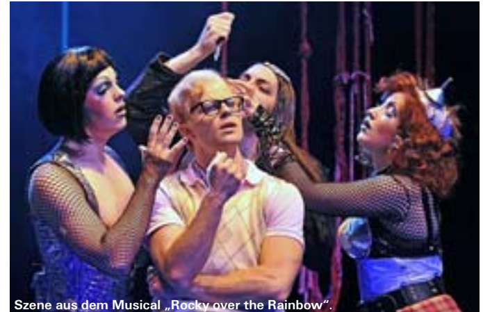
Szene aus dem Musical „Rocky over the Rainbow“.