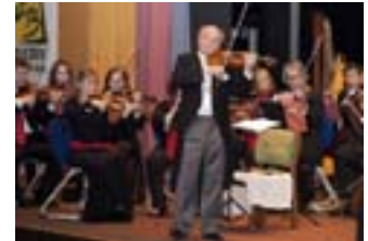
István Szentpáli und Orchester

mit Vorprogramm zum Themenjahr 2014 „Burgdorf: Hier findet Ehrenamt Stadt!“ Theater am Berliner Ring VVV + Stadtmarketing Burgdorf + Stadt Burgdorf Kartenvorverkauf: Bleich Drucken und Stempeln, Braunschweiger Straße 2