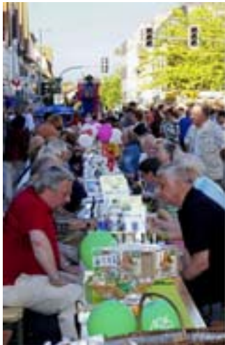
Burgdorfs Bürger sind als Ehrenamtliche Spitze.